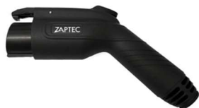
Original Zaptec type 1