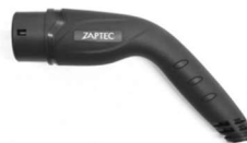
Original Zaptec type 2